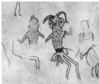
Pintura en el interior de grutas en la meseta de Tassili-Ajjer, cercana al macizo de Abaggar (más de 1,400 Km de Argel). VII milenio a.C.

También se han encontrado obras de arte prehistóricas en las que aparece sin rubor la masturbación femenina. Lo ejemplifica muy bien la escultura en madera de Sacerdotisa Bilian de Diosa Rangda con cabeza de primate y lengua afuera , hallada en Indonesia y dos escurturillas recogidas en el yacimiento cercano al río Yarmuk, Canaán, —antigua región del Próximo Oriente—, datadas en el