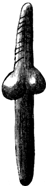
En Dolni Vestonice, región checa de Moravia, se encontraron bastones fálicos pertenecientes al paleolítico superior.

El arte, como documento histórico, demuestra explícitamente el desenfado prehistórico hacia el